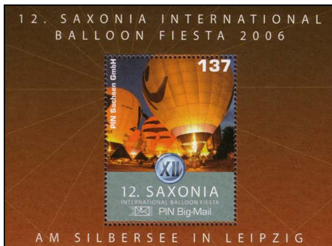
Block Nr. 4