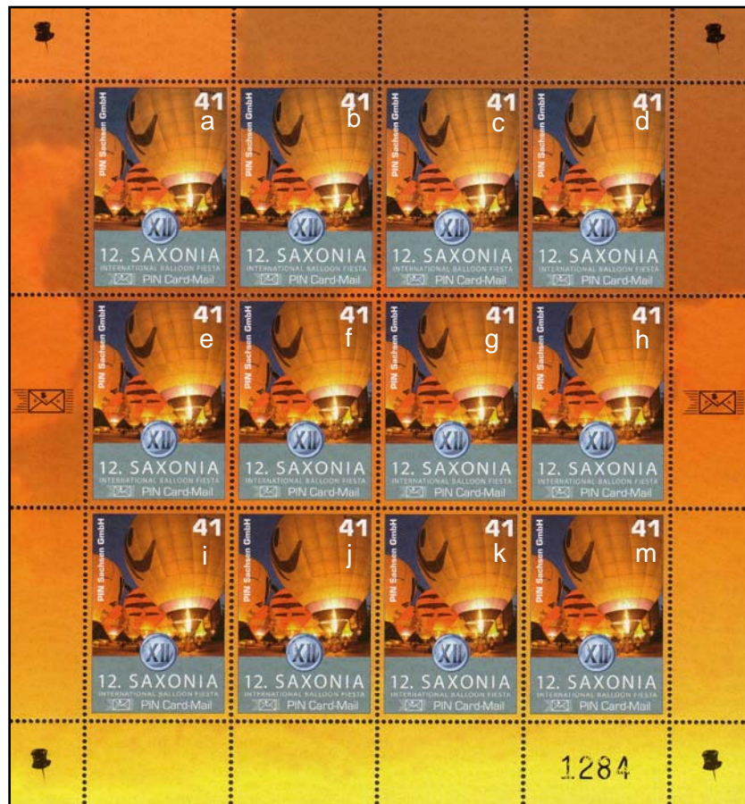
Schalterbogen PSA Nr. 23

Zur Ausgabe erschien ein Ersttagsklappkarte (1.000 Stück) sowie ein Ersttagsstempel (PSA EST Nr. 9). Außerdem gab es 2.000 Postkarten zum Ereignis, die per Ballonpost versendet werden konnten.