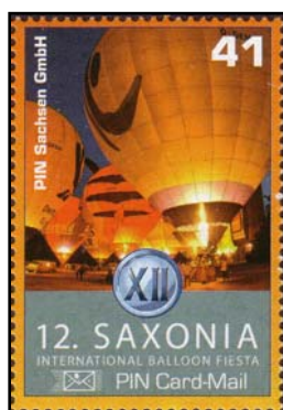
PSA Nr. 23