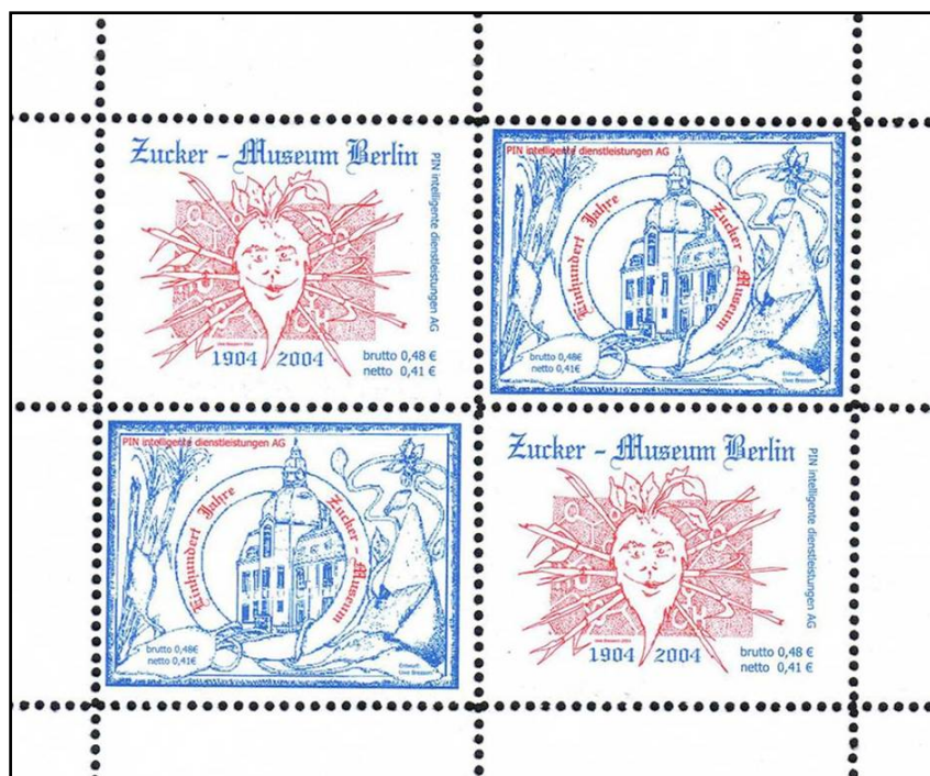
Kleinbogen Nr. 1