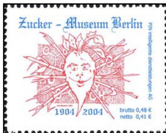
PBE Nr. 33