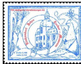
PBE Nr. 34