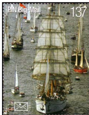
PBE Nr. 148