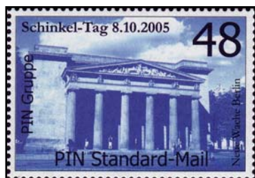
PBE Nr. 108