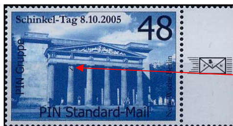
PBE Nr. 108 IF (Feld 6)