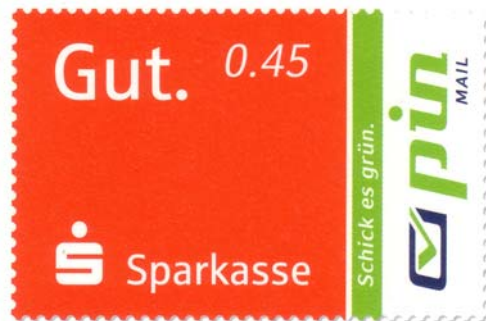
Markenmotiv Nr. 2