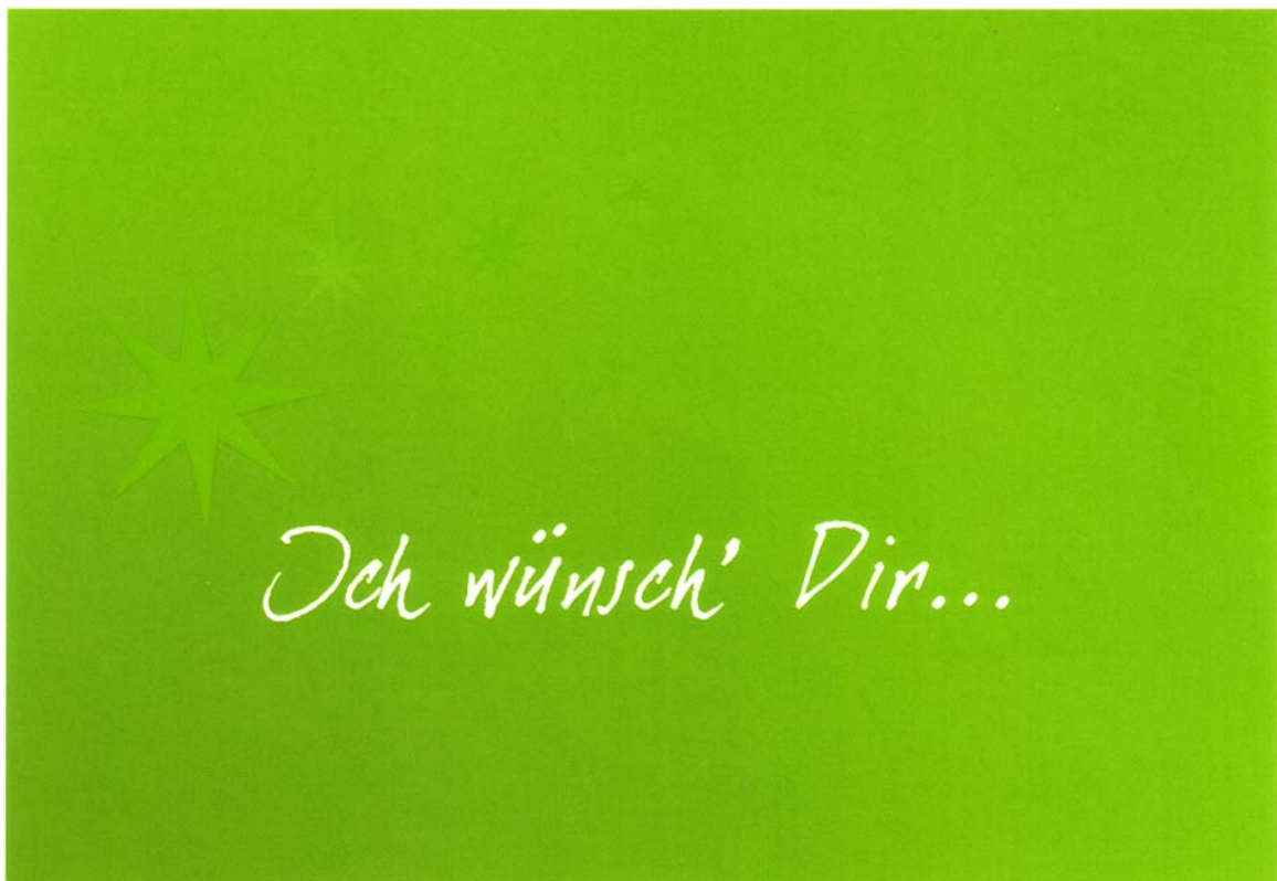
Bildmotiv-3: Ich wünsch` Dir ... (BM-3)