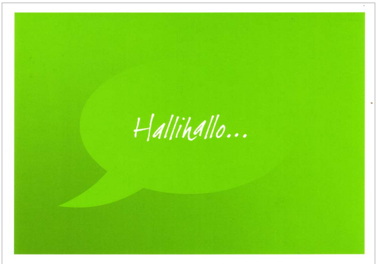
Bildmotiv-1: Hallihallo... (BM-1)