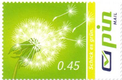
Markenmotiv Nr. 1