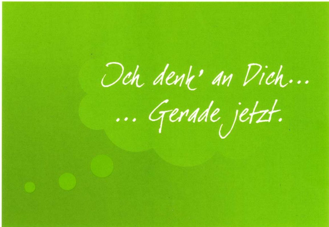
Bildmotiv-2: Ich denk` an Dich ... ...Gerade jetzt. (BM-2)