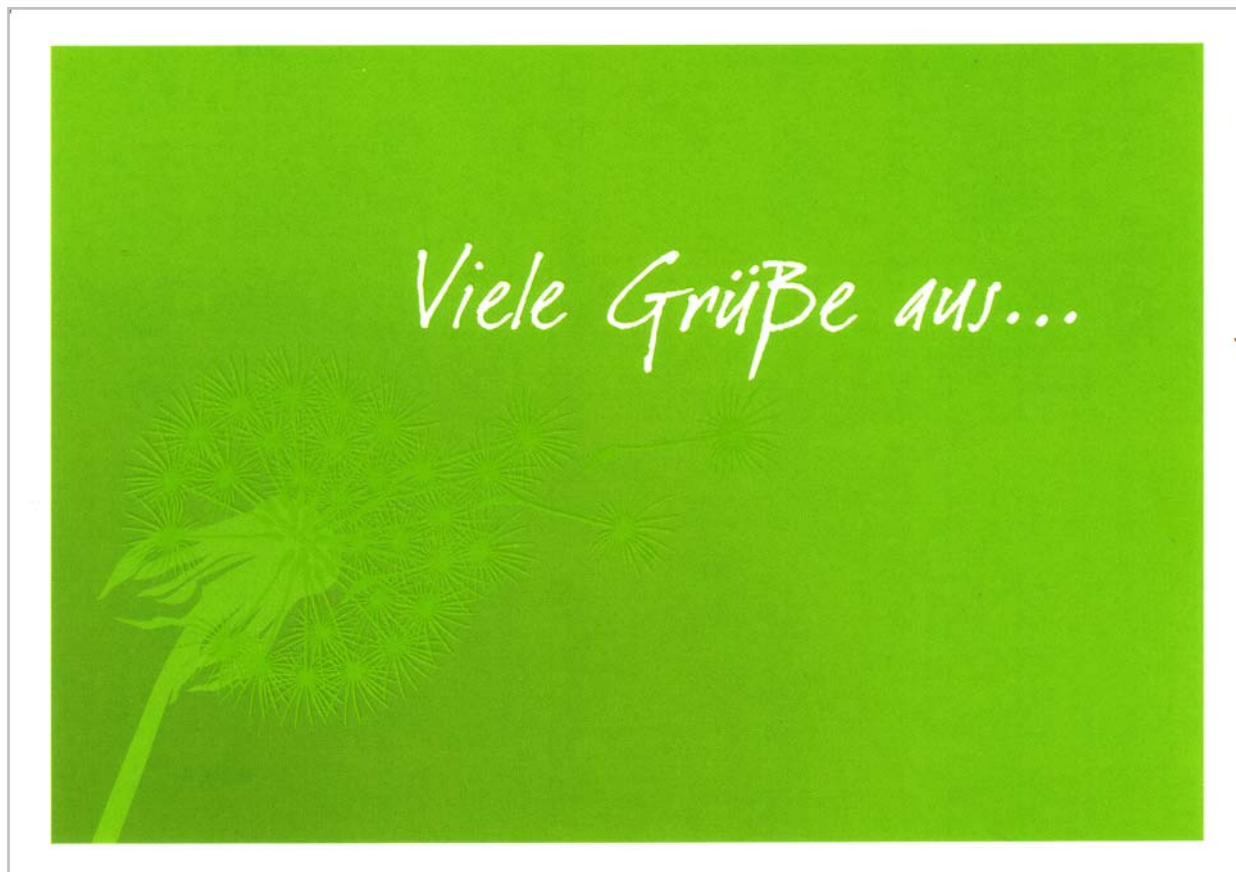
Bildmotiv-5: Viele Grüße aus ... (BM-5)